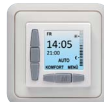
Jung ST 550