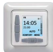
Berker Modul 2