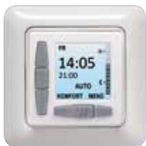
Berker Modul 2