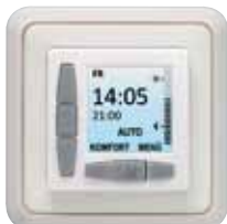
Jung ST 550